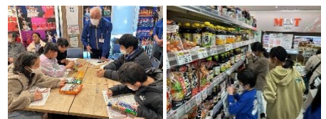
「子ども向け減塩ワークショップ」の様子