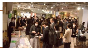
オープンフォーラム2025

オープンフォーラムは、イニシアチブ全関係者（参画事業者、有識者委員等）に加え、一般参加も可能。今年度は、学術関係者からの講演や参画事業者からの取組発表に加え、多業種の関係者によるパネルディスカッション、参画事業者紹介ブース出展を実施した。事業者、自治体担当者、メディア等、約250名以上が参加した。