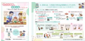
消費者向け啓発資料